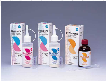
医療用具承認番号 21400BZZ00451