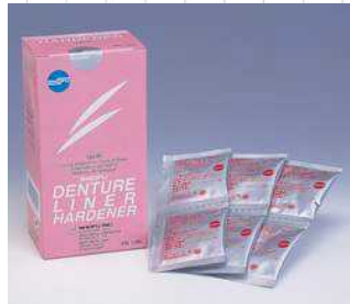
医療用具承認番号 20900BZZ00452