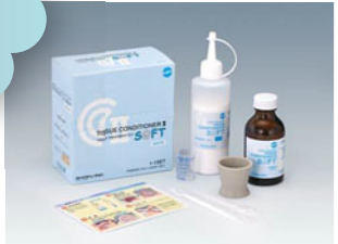
義歯床用短期弾性裏装材 『松風ティッシュコンディショナーII ソフト』

松風ティッシュコンディショナーIIの使いやすさを継承しつつ、印象時に練和物が広がりやすく、硬化後はやわらかい特性にしました。そのため、粘膜面をそのまま再現でき、即日の加圧印象（咬座印象）に適しています。また、粘膜調整においては、適度なやわらかさであることから、咬合圧を緩和でき、患者さまの粘膜面への負担を軽減します。