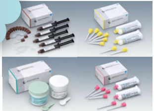
歯科用シリコン印象材『ジルデフィット』

「永久ひずみは極力小さく」、しかし「弾性ひずみは極力大きく」、そして「親水性はできるだけ高く」なるよう設計され、細部再現性に優れたシリコン印象材です。難易度の高いシリコン印象採得時に、できるだけ失敗が起きないように工夫されています。よりよくご使用いただくために「上手な印象採得のためのステップガイド」もご用意しました。