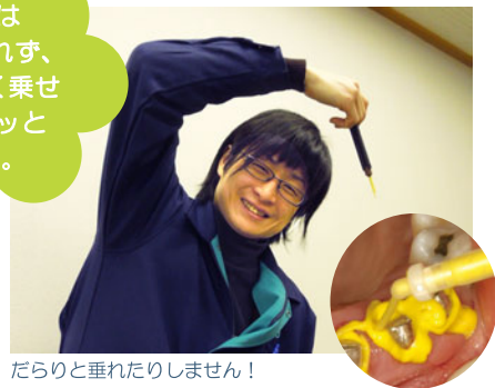
だらりと垂れたりしません！