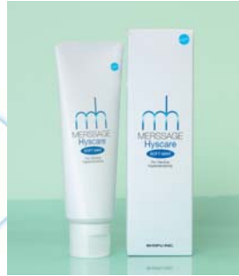
薬用歯磨 医薬部外品 歯科医院用 メルサージュ ヒスケア 80g (標準患者価格・消費税抜き)