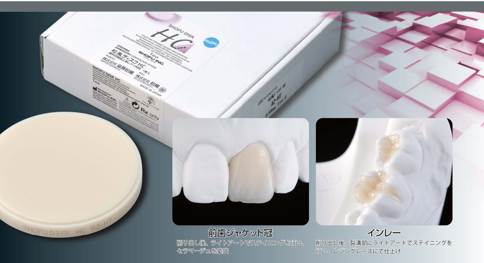
前歯ジャケット冠