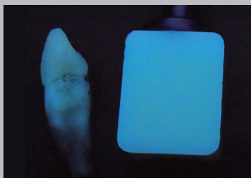
写真右は松風ブロック HC