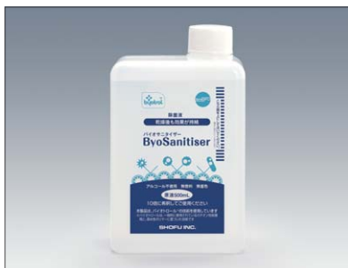
バイオサニタイザー 500mL