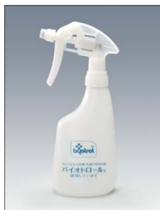
バイオサニタイザー スプレー容器 (500mL用) 1本