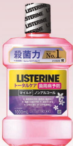
Home Used Test 日本人女性115人 2022年11月 Expert Panel test 2022年11月