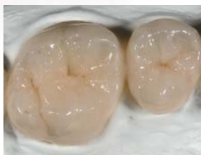
小窩裂溝にブラックブラウンやダークレッドブラウンを使用*

特にシェードステインのグループには、セラミックス修復物用の外部ステインとセラミックスフレーム用の内部ステインの2系統を用意し、精度の高い色調再現を可能にしています。※: グレージングペーストを含む