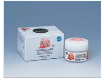
【単品販売】ペースト 3g 1本 希釈液 50mL 1本