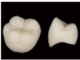
プレス成型後のクラウン

また、歯科用セラミックスフレーム材(アルミナ、ジルコニア)およびプレス用セラミックスやCAD/CAM用ポーセレンブロック、既製陶歯などの歯科用セラミックス材料に幅広く使用することができます。