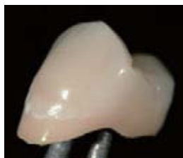
脱灰部にコーンイエローおよびホワイトを使用*