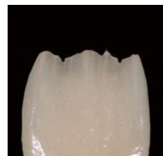
マメロン構造部にマメロンピンクを使用