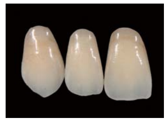
形態修整および色調調整後