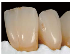
ヘアライン・クラックライン部にブラウンおよびホワイトを使用**