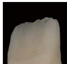
切端部にブルーおよびブルーグレーを使用