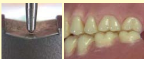
※インサイザルピンの浮き上がりの様子 ※レジン重合後の咬合器装着時の様子