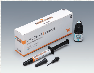
歯科レジン系補綴物表面滑沢硬化材 レジングレイズ [ジェルセット] セット