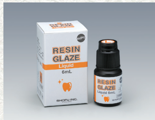
歯科レジン系補綴物表面滑沢硬化材 レジングレイズ [リキッド] 6mL