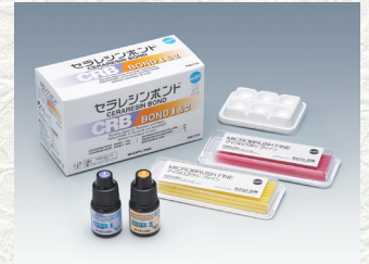
歯科レジン用接着材料 歯科セラミックス用接着材料 セラレジンボンド セット