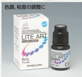
クリアリキッド 6mL 1本