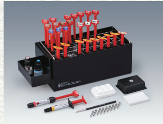
歯冠用硬質レジン ソリデックス ハーシェル セット スタンダード セット