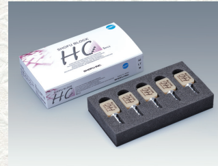
歯科切削加工用レジン材料 松風ブロック HC(5個入) 単層 Sサイズ Mサイズ 2レイヤー Sサイズ Mサイズ