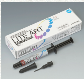
カラーペースト 1mL 1本