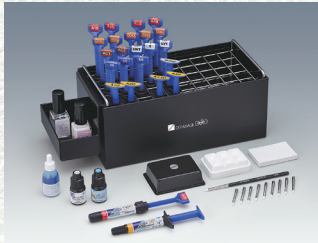
歯冠用硬質レジン セラマージュ デュオ システム ベーシック Aセット セット