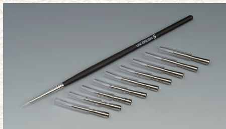
ユニブラシNo.5 (筆柄1、筆先10)