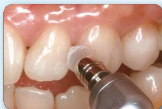
No.S13 ペンシルタイプ使用

▶ とがった先端部とブラシの細さ、柔らかさを活かして、狭い歯間部や小窩裂溝や叢生などの清掃に適しています。