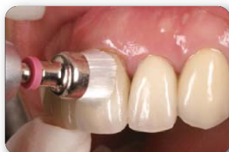
No.S2 フラットリング使用