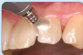
No.S11 フラットタイプ使用

▶ ブラシの細さと柔らかさを活かして、歯頸部に入り込んだバイオフィルムや軽度の着色除去に適しています。