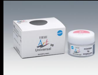
ステイン 2g GP-F