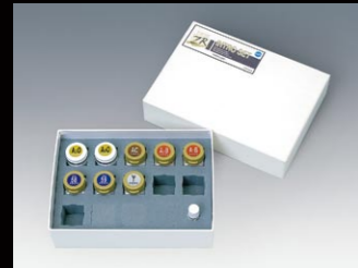
ヴィンテージ ZR イントロセット 他各種セット、単品有り