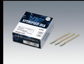
松風ビトリファイドダイヤ HP No.28,29,42,43 3本入 No.11 2本入 No.20 3本入 No.10,70 2本入 ※CA、FGもあります