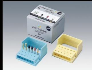
ジルコシャイン セレクトキット