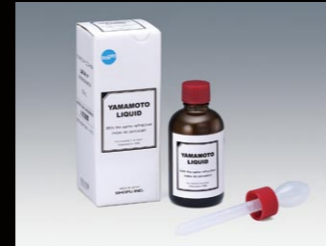
山本リキッド 50mL 専用液 50mL