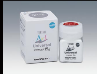
グレーズ 15g GP