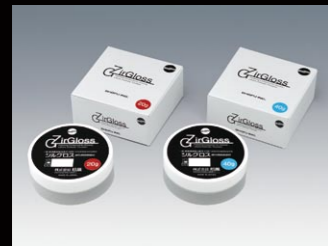
ジルグロス 20g 40g