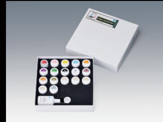
ベーシックセット