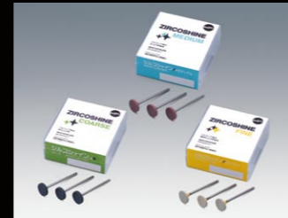
ジルコシャイン HP No.10,11 3本入 No.28 4本入 ホイール5 1枚入 ※CAもあります