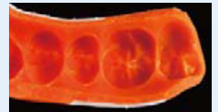
成形されたシート