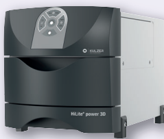
ハイライトパワー 3D 光重合器