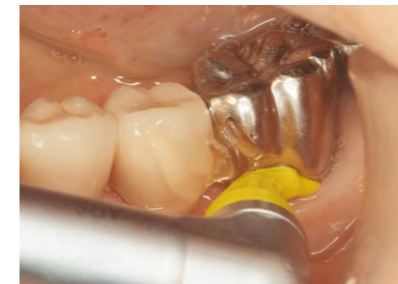
補綴装置装着後の二次う蝕予防