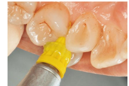
叢生部位のう蝕予防