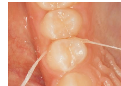
隣接面のう蝕予防にデンタルフロスで塗布