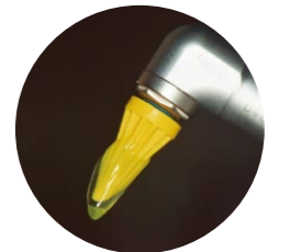
メルサーージュカップNo.13

セルフケアでは、ブラッシング後に歯ブラシを使用して歯面全体に塗布する他、タフトブラシ、歯間ブラシ、デンタルフロスを使用してう蝕予防を行うようにアドバイスできます。