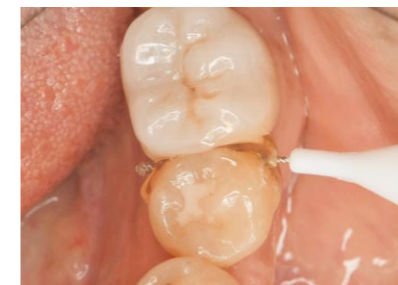
補綴装置隣接面の二次う蝕予防に歯間ブラシで塗布