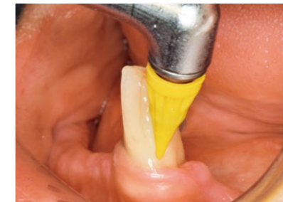
高齢者ドライマウスの根面う蝕予防