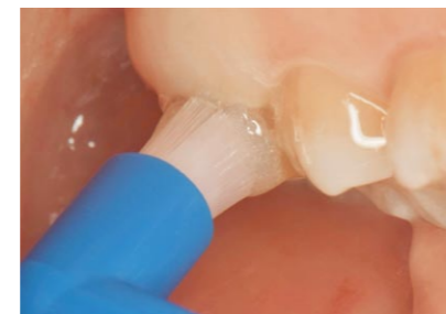
萌出途中の永久歯のう蝕予防にタフトブラシで塗布