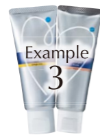
Example 3 セルフケア

セルフケアでは、ブラッシング後に歯ブラシを使用して歯面全体に塗布する他、タフトブラシ、歯間ブラシ、デンタルフロスを使用してう蝕予防を行うようにアドバイスできます。