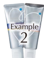
Example 2 PMTCの仕上げに

PMTC後、メルサーージュカップにクリアジェルをたっぷり取って歯面全体にすり込むように塗布する。