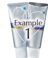
Example 1 初期カリエスや脱灰部位

メルサーージュカップNo.15PIにクリアジェルをたっぷり取って歯面のプラークを剥しとるようにクリーニングする。