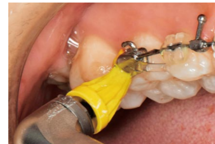
矯正治療中のう蝕予防