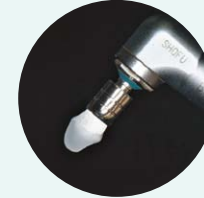
メルサージュ ブラシ ソフトNo.S13

症例 2 Hysでブラッシングが疎かになっているケース Hys症状が強く、セルフケア (ブラッシング) が疎かになっている患者さまの PMTC時にメルサージュ ブラシ ソフトNo.S13と併せて使用。