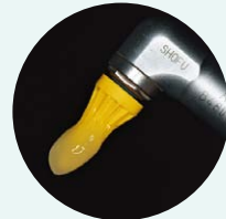
メルサージュ カップNo.13

症例 1 歯肉退縮により根面が露出しているケース メンテナンス (SPT) 時、スケーリング・PMTC後の仕上げに メルサージュ カップNo.13を使用してソフトタッチで塗布するように 擦り込む。(Hys予防・根面う蝕予防)