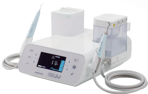
MERSSAGE E-PICK 2in1