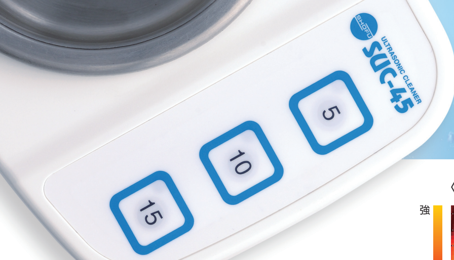
〈超音波の強度分布〉