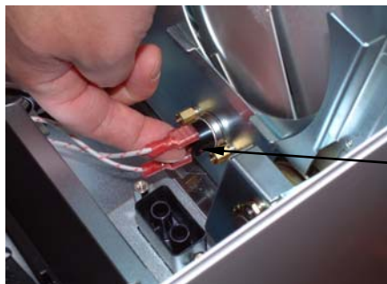
サーモスタット 復帰ボタン